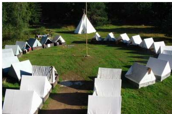
(Základna OTŠ v Kadově)

OTŠ plnila po stránce odborné i výchovné svou funkci. Potěšil nás také zájem z řad účastníku o dění kolem UTŠ. Doufejme, že jim nadšení vydrží a potkáme se s nimi za rok na Slunečné pasece.